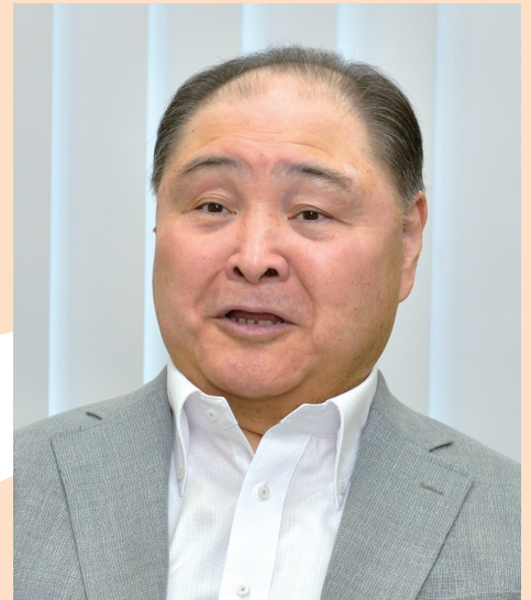
ことかぜ・こういち 琴風浩一

1957年4月26日、三重県津市出身。本名・中山浩一。71年、中学2年で上京して琴櫻の内弟子となり、やがて佐渡ヶ嶽部屋に所属。同年の7月場所で初土俵を踏む。77年1月場所で新入幕、78年1月場所で関脇に昇進。81年9月場所で初優勝、場所後に大関昇進を果たす。83年1月場所で2度目の優勝。85年11月場所3日目終了後に引退を発表。その後、年寄「尾車」を襲名し、尾車部屋を創設。豪風や嘉風などの関取を育てた。2012年の日本相撲協会理事就任後は、巡業部長や事業部長を歴任し、相撲界の発展に尽力した。24年5月に日本相撲協会を退職。通算成績は87場所で561勝352敗102休。