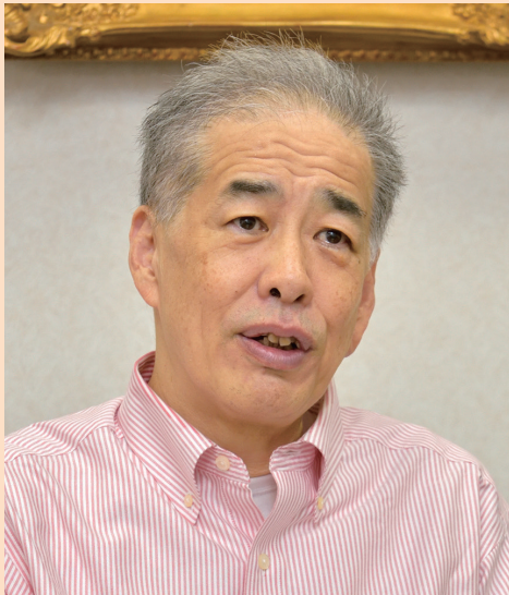
にのみや・せいじゅん 二宮清純

1960年、愛媛県生まれ。スポーツ紙や流通紙の記者を経て、フリーのスポーツジャーナリストとして独立。著書に『勝者の思考法』（PHP新書）、『ワールドカップを読む』（KKベストセラーズ）、『プロ野球「衝撃の昭和史」』（文春新書）、『広島カープ最強のベストナイン』（光文社新書）、羽生善治との共著『歩を「と金」に変える人材活用術』（廣済堂新書）、『森保一の決める技法』（幻冬舎新書）、『対論・勝利学』（第三文明社）など多数。